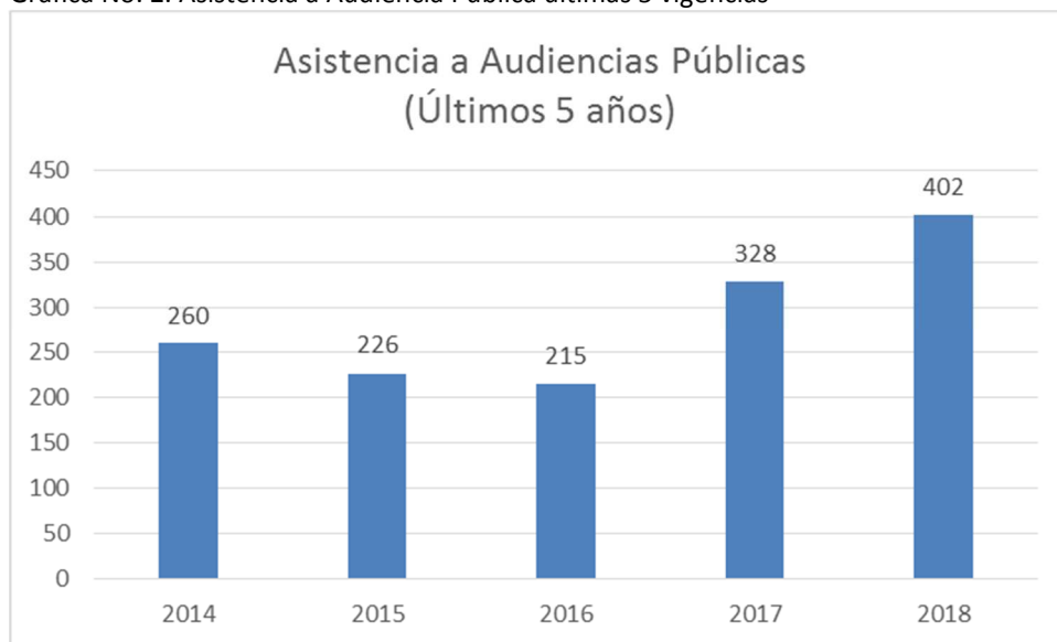
Gráfica No. 2. Asistencia a Audiencia Pública últimas 5 vigencias